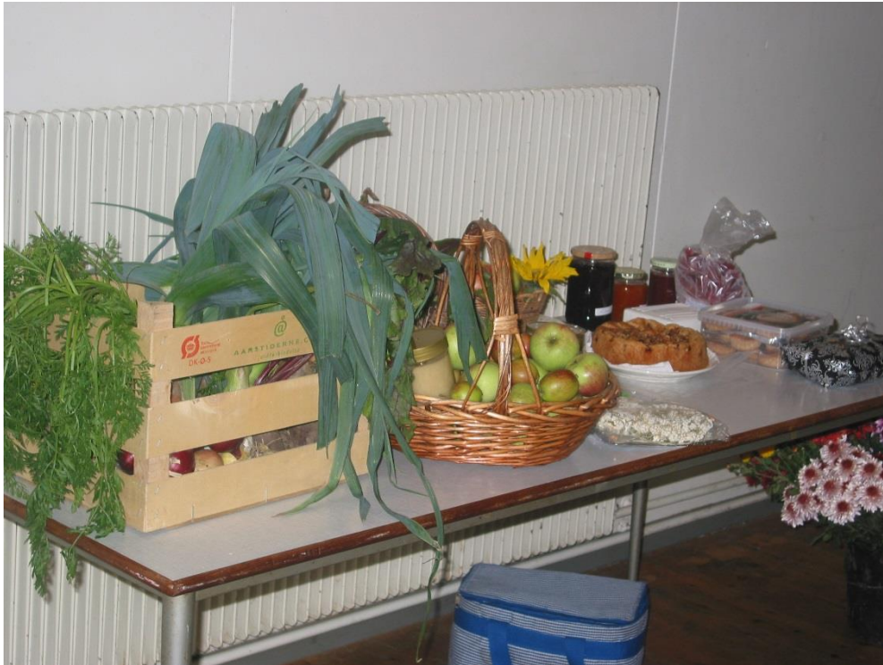
Medbragte afgrøder ved tidligere høstgudstjeneste

Mandag den 3.oktober er der morgensang i sognegården kl.9.30. Kom og vær med til at synge nogle morgensalmer og andre gode sange fra Højskolesangbogen.