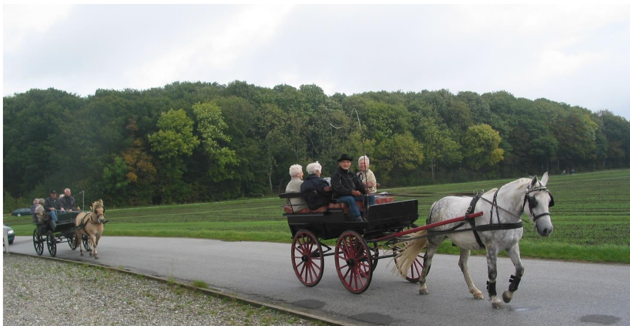
Fra tidligere høstgudstjeneste på Gersdorffslund

Kulturuge 40 i Hou og omegn, som vi har kendt den i mange år, er nedlagt, men i menighedsrådet har vi besluttet, at vi vil prøve at lave noget, vi kalder "Kirkekulturuge 40".