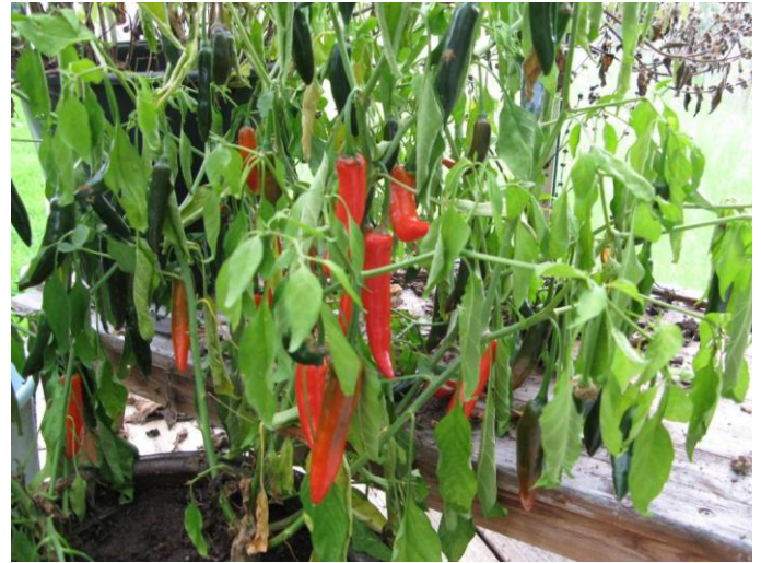
I drivhuset synger tomaterne og peberfrugterne på sidste vers