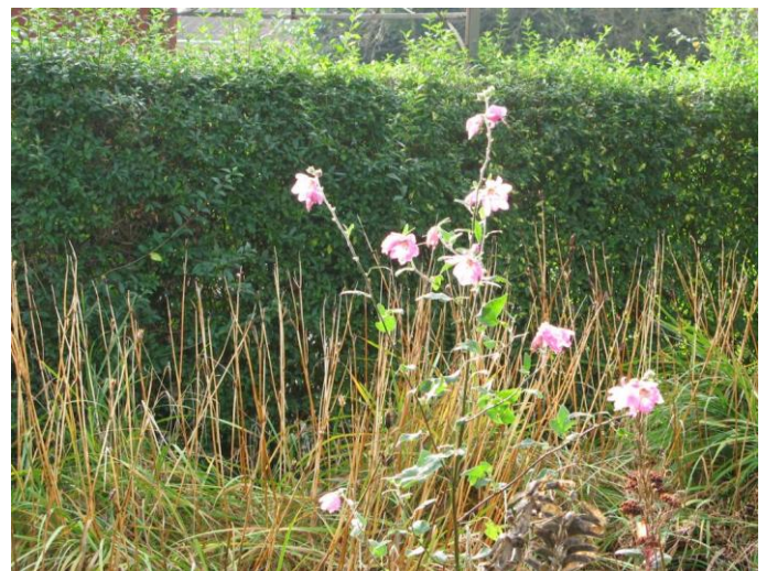
Fuglebrættet er klar til vinterens gæster, og efterårsfarverne breder sig i blomsterbedet