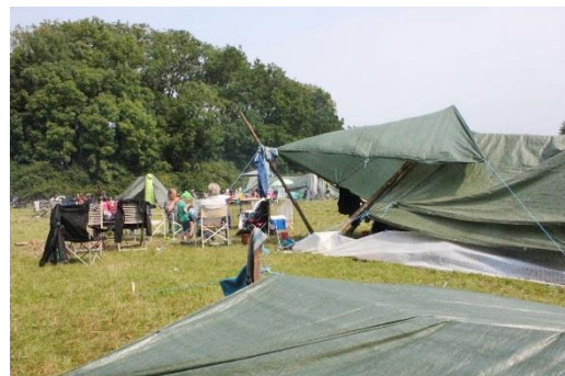
Et telt skal først og fremmest være vandtæt, men lidt kreative løsninger på indgangspartiet skader ikke.

Fredag aften sluttede af med natløb, hvor børnene klassevis og i lyset af en hel klar stjernehimme og ikke mindst de mange medbragte lommelygter gik en god tur rundt i området. Efter en lang dag, først i skole og så ude i det fri, var det nogle trætte børn, der indtog natmaden i form af pandekager bagt over bål.