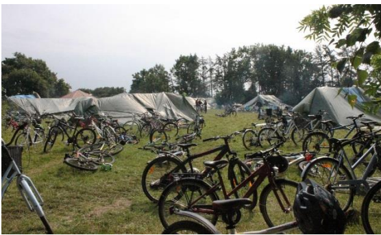
En færdig lejr med telte til hver klasse står klar til weekendens aktiviteter.