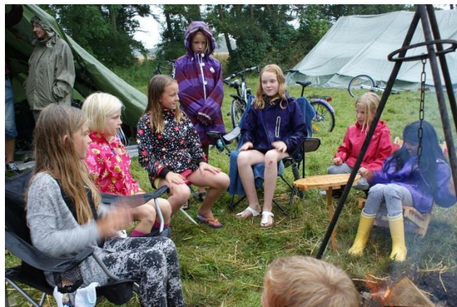
Regnvejr er ikke nogen hindring for at hygge sig omkring bålet, i hvert fald ikke for pigerne i 3. klasse.

Det var derfor nogle efterhånden utålmodige børn, som sidst på formiddagen kunne gå i gang med aktiviteterne.