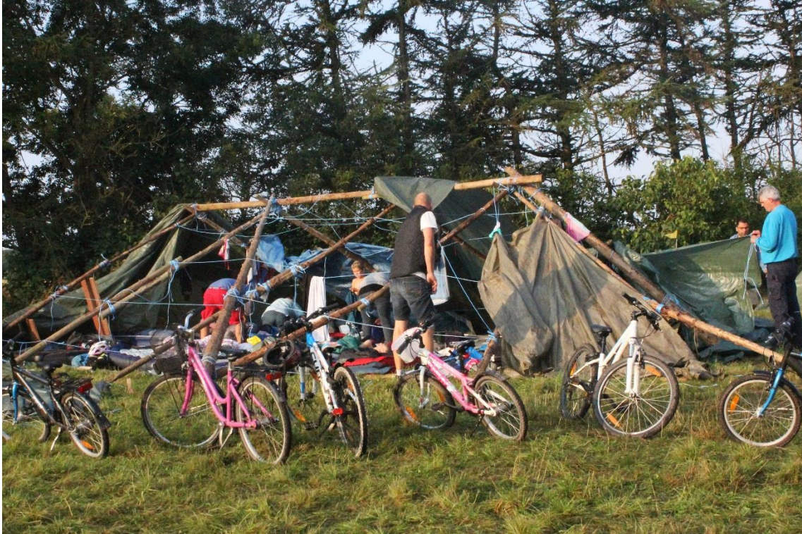
Søndag morgen er det hele slut. Mens nogle af børnene stadig sover begyndes arbejdet med at pille hele lejren ned igen.