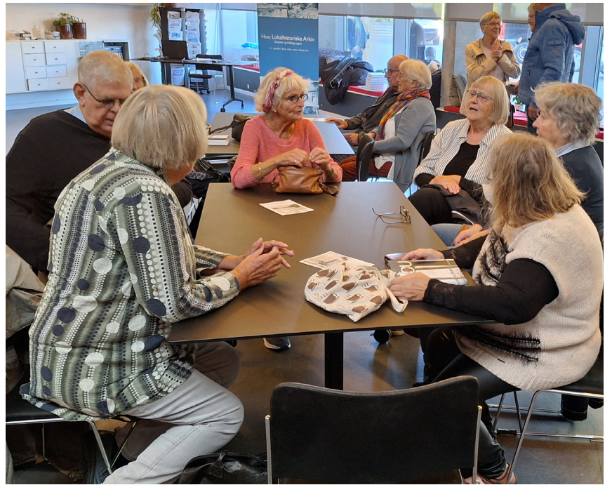
Et lille udsnit af de mange receptionsgæster