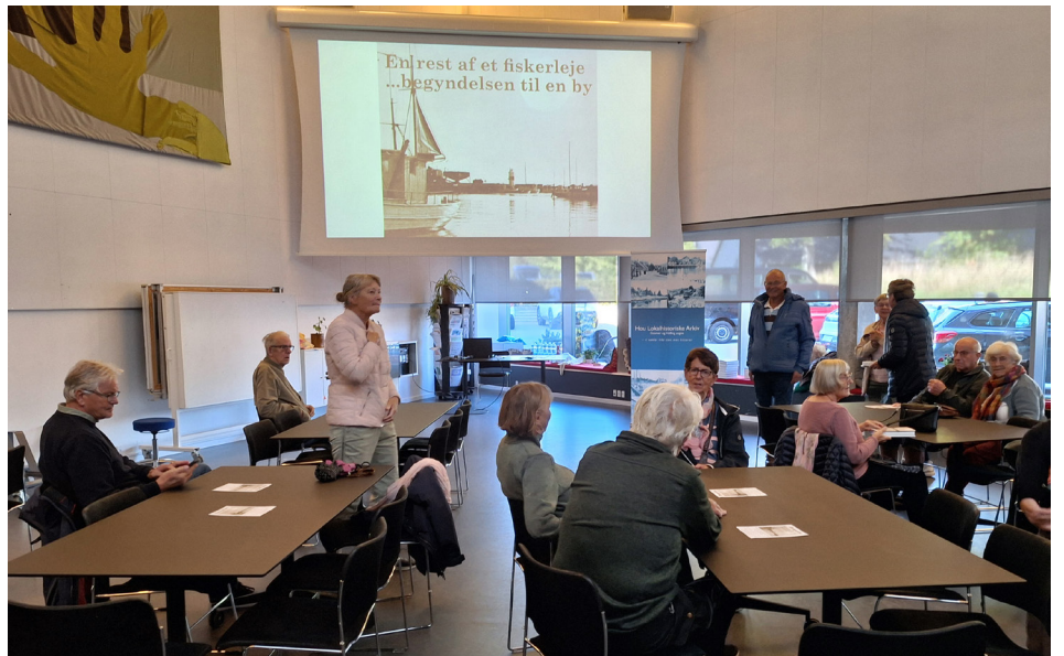
Udpluk af bogens indhold blev præsenteret på storskærm