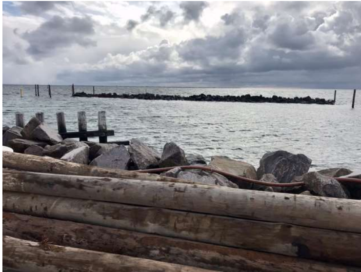
Den nye bølgebryder