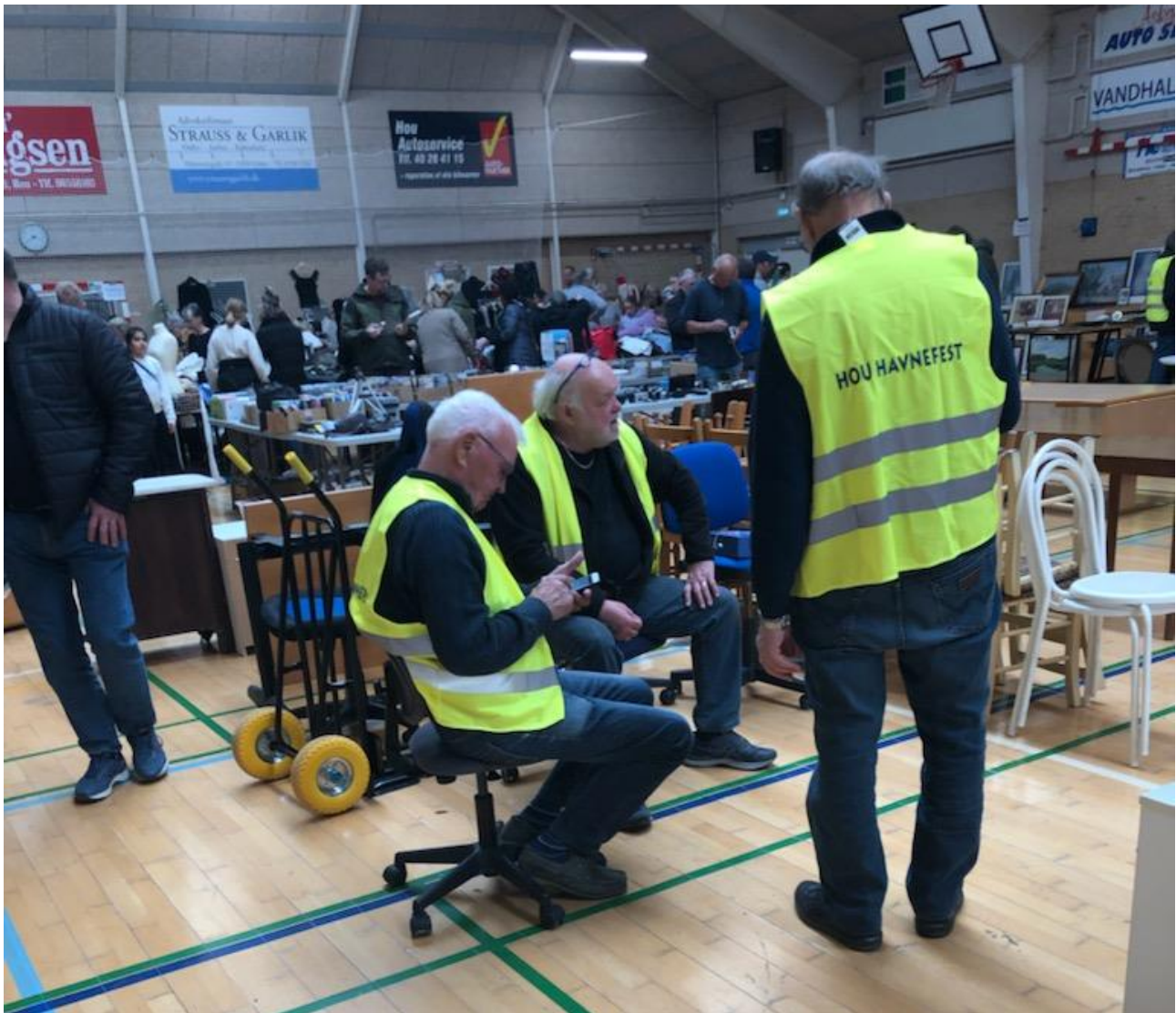
Trætte medhjælpere der tager sig et velfortjent hvil

Dejligt at være en del af et lokalsamfund med så mange frivillige ildsjæle. Og omsætningen var på lige knap 87.000 kr. Flot!