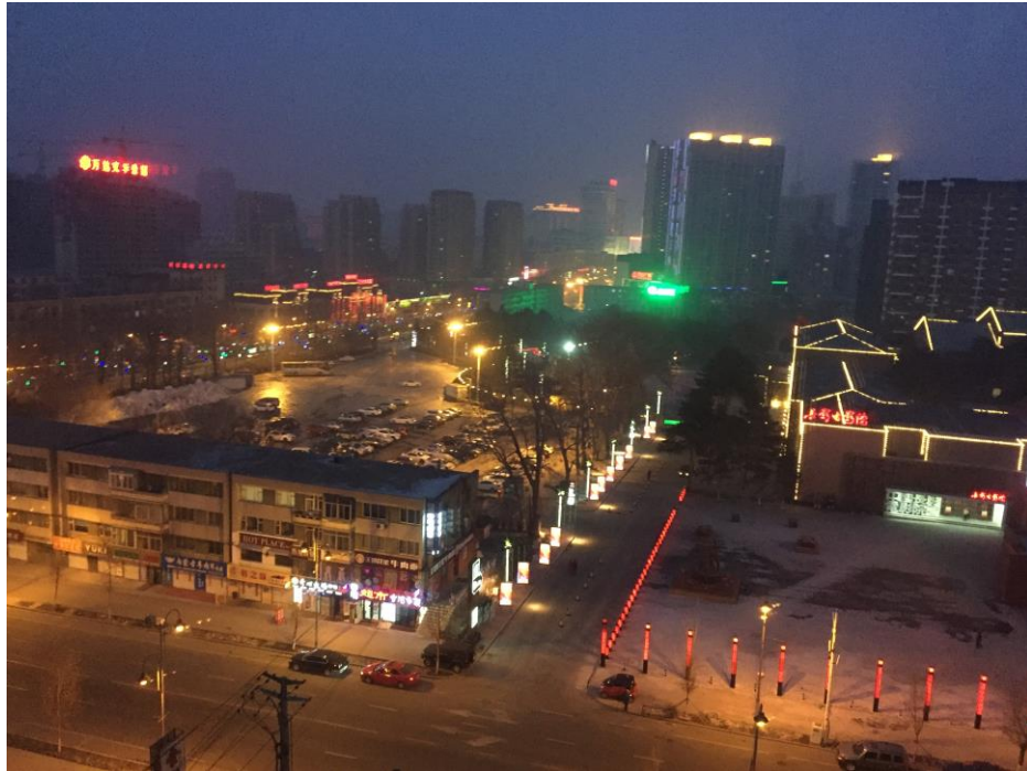
Udsigt fra Bente og Jons lejlighed