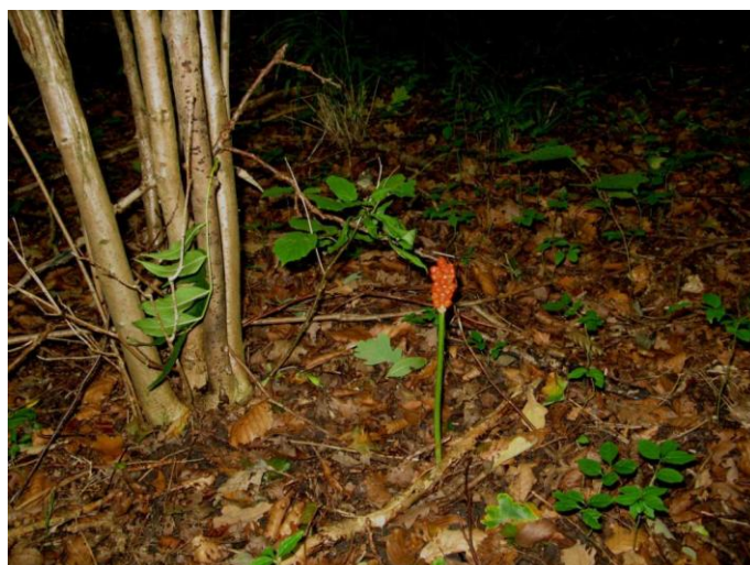
Giftige planter ...

Men skoven var som forhekset. Stierne førte gennem brombærkrat og det, der var værre, skovvejene var pløjet op af gigantiske hjulspor, som så var fyldt med vand og dermed ufremkommelige. Hvis der endelig var et farbart spor, så var det alligevel ikke så farbart endda, fordi der var væltet store træer ud over. Altså måtte jeg ud i urskoven.