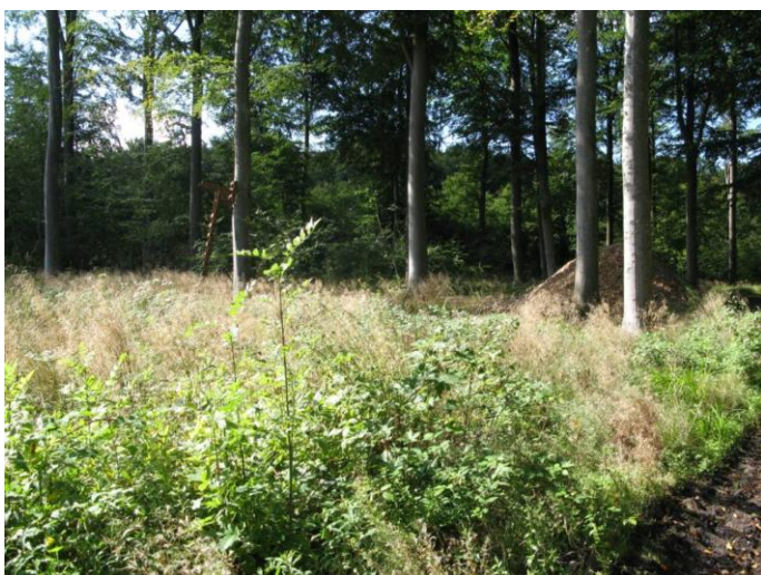
... kæmpemyrer? ...