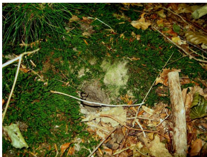
... og skovmus var med til at forøge uhyggen