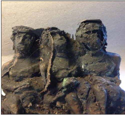
De tre Gratier