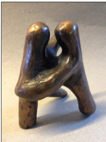
Pas des deux