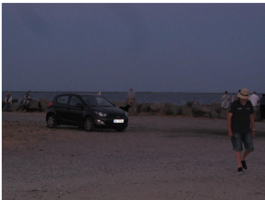
Mens vi venter ...

Vel tilbage på matriklen kunne månen nu ses over Medborgerhuset, og formørkelsen var synligt i aftagende. Sammenlignet med hvor meget lys månen kastede af sig aftenen før, så var den dog stadig som en lygte, der var ved at gå tør for strøm.