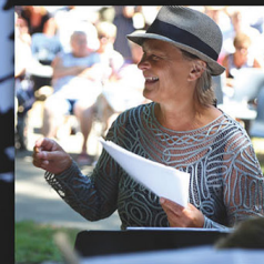
Big Fies Big Band - traditionen tro