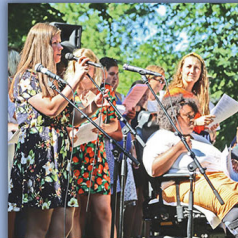
Musik og taler ved højskolens elever