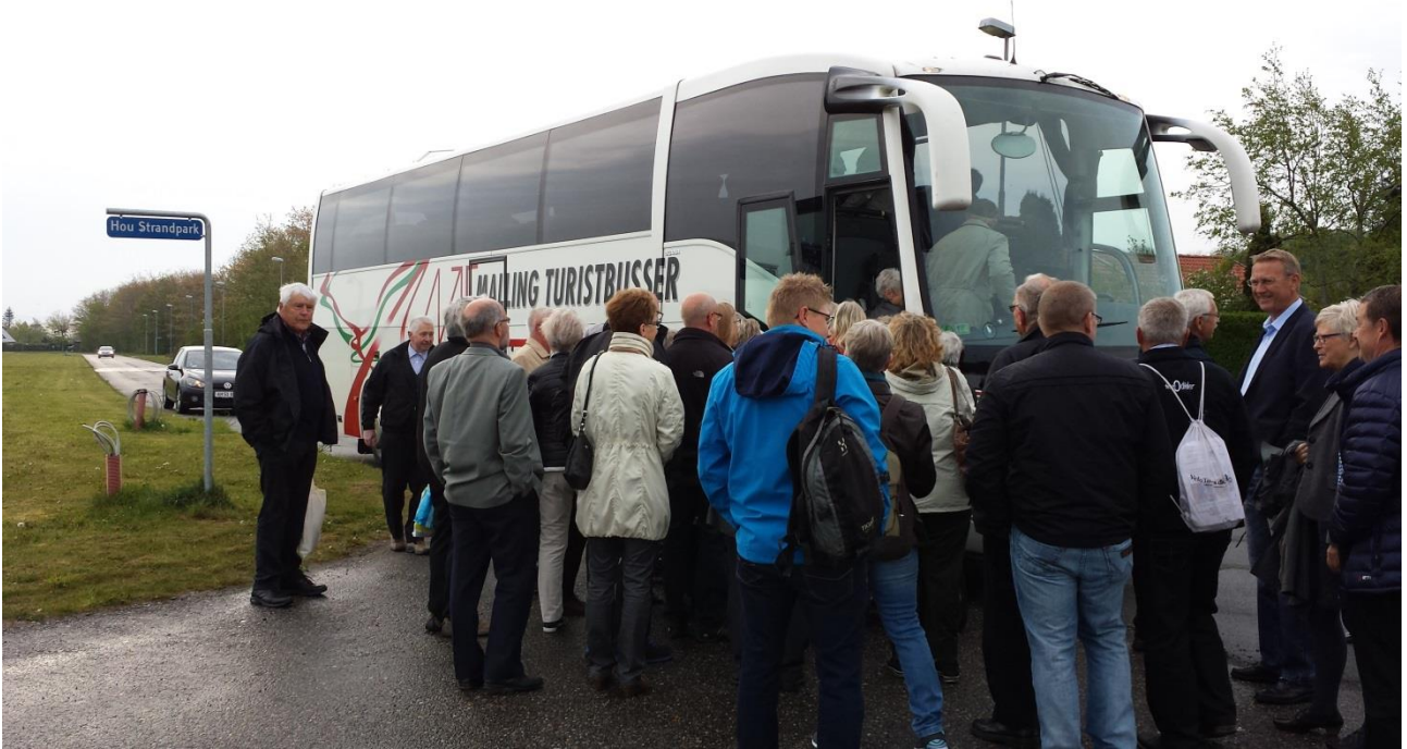
51 Houborgere drog forventningsfulde med bus til København, den 6.5. kl. 7.00 præcis fra Askelunden.