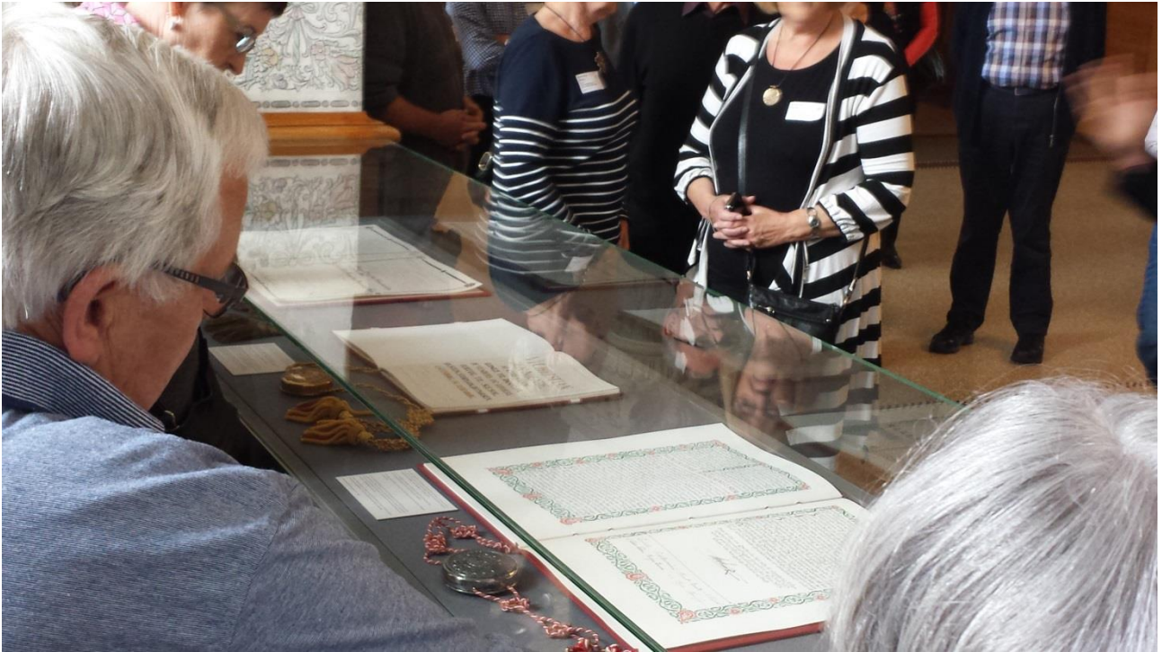
Her ligger den, som det hele drejer sig om, nemlig Danmarks Riges Grundlov.