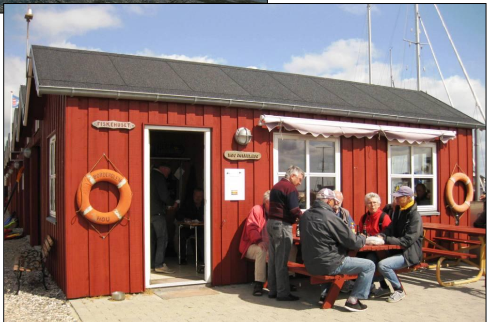
Hygge ved Hou Jollelaugs klubhus, som må siges at have den bedste placering i Danmark.