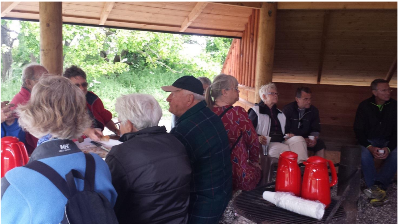
Kaffe og kage ved Høvløkke Strand - inde under halvtaget af den store shelter.