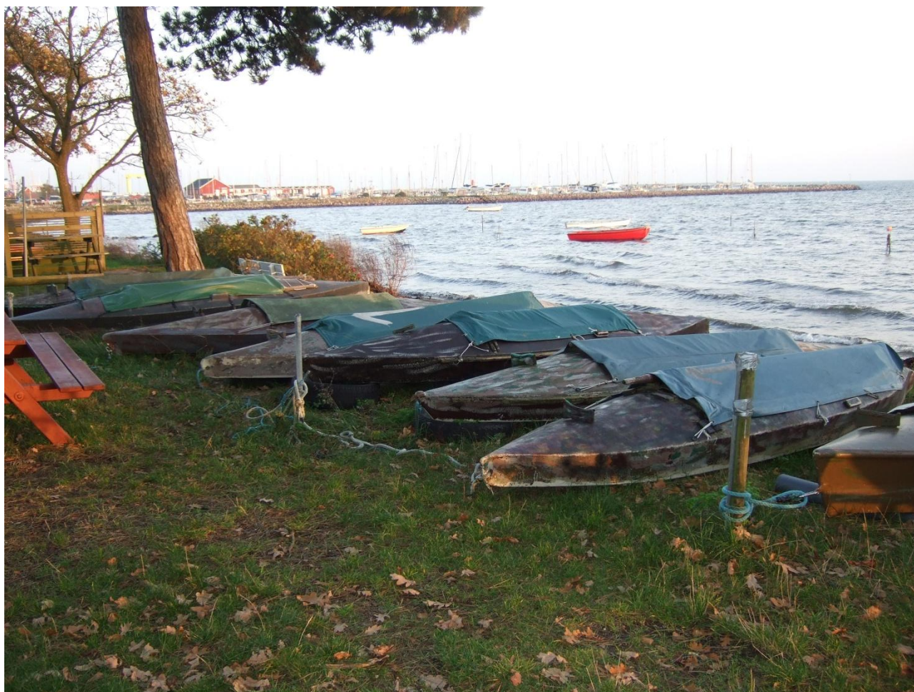
Også strandjægerne holder til på strandarealet.