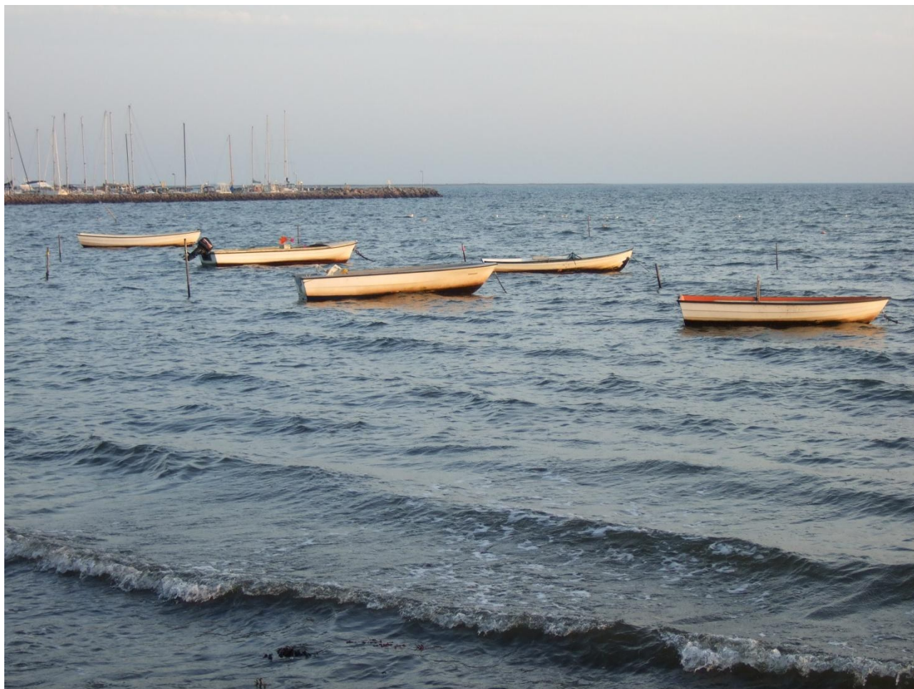
Jollerne ligger for svaj ud for strandarealet.