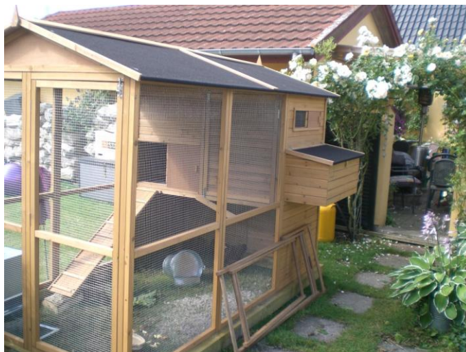
Inge Lise og Tommys hønsehus

24.07.2014/Tekst og foto: Ingrid Ravnsbo